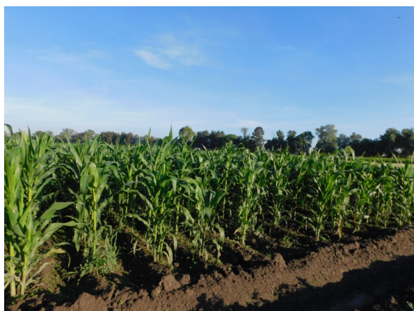
Figura 2. Lote de producción de semilla básica de la variedad sintética de maíz CP-Tania 5. Montecillo, Edo. Méx. 2019.

La variedad sintética de maíz CP-Tania 5 es de alto rendimiento (8.6 t ha -1 ), posee resistencia genética