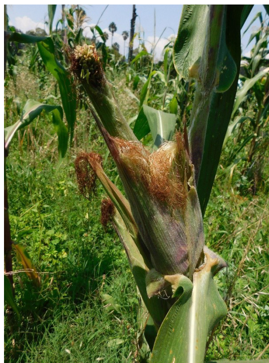
Figure 1. Symptom associated with ‘monkey’s hand’ in maize ears.